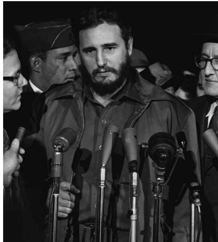
autor neznámy; Fidel Castro - MATS Terminal Washington 1959.jpg; http://cs.wikipedia.org/wiki/Soubor:Fidel_Castro_-_MATS_Terminal_Washington_1959.jpg