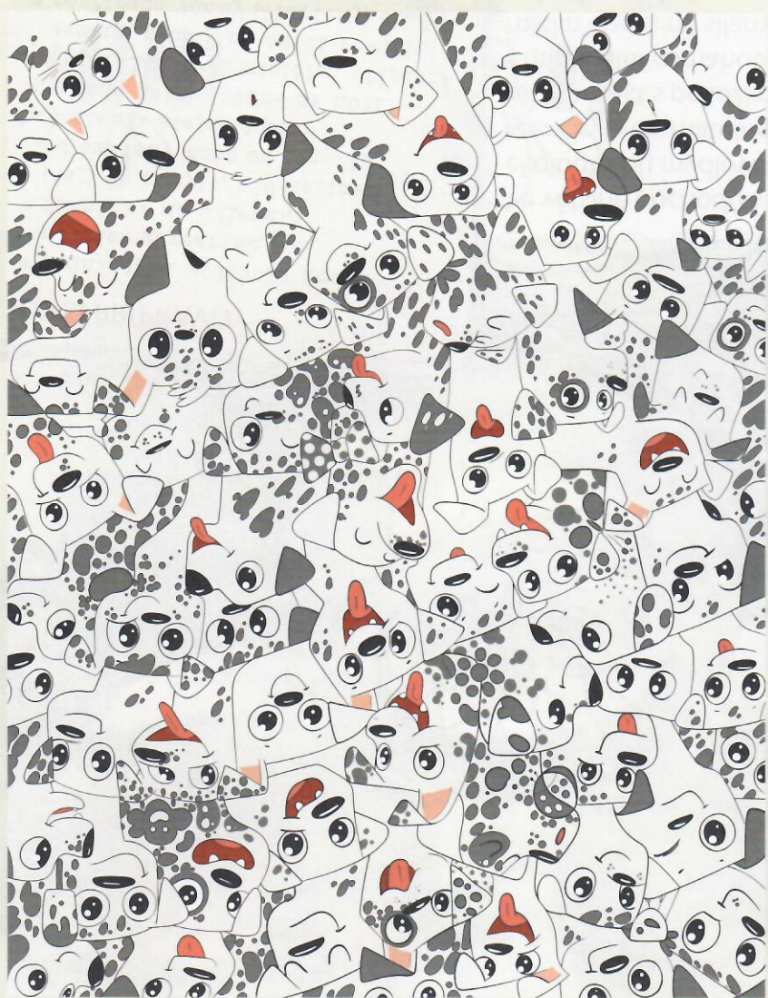
JAK NA TO * kouzlení (nejen) s nužkami