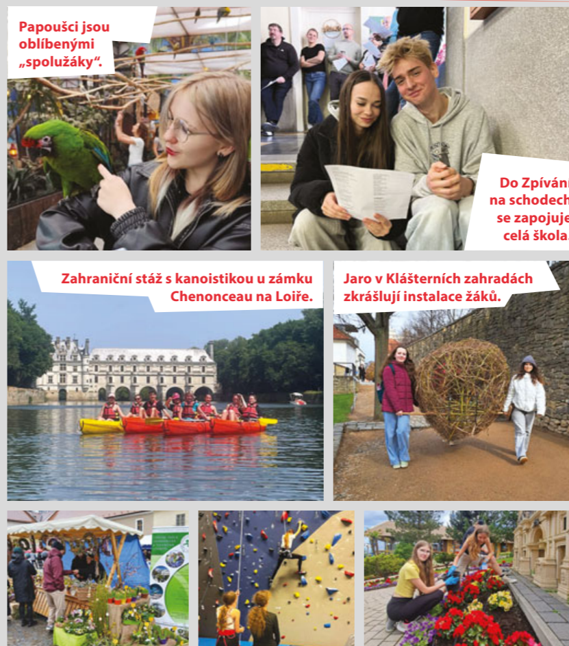
Papoušci jsou oblíbenými „spolužáky“.