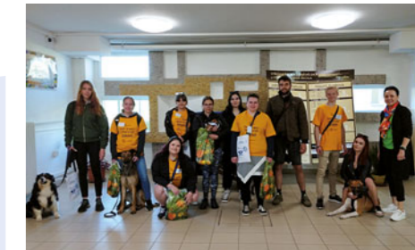
Žáci ze zemědělký mají dobré srdce a charitativní akce je nenechávají chladnými. Každoročně se zapojují do sbírek Český den proti rakovině a finančně přispívají nadaci Dobrý anděl.