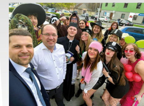
Letos v květnu navštívil školu ministr životního prostředí Petr Hladík s poslanci Markem Výborným a Davidem Šimkem – stihl při tom i společné selfie s účastníky posledního zvonění.