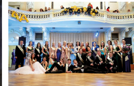
Na maturitních plesch školy elegantní obleky i krásné róby studentům a studentkám náramně sluší.