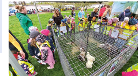
Při oslavách Dne Země láká stanoviště chrudimské „zemědělký“ především na výstavku hospodářského zvířectva.