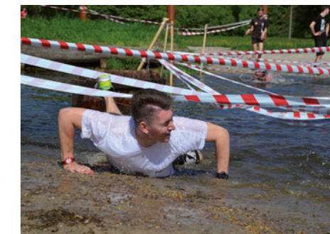
Mezi žáky jsou i tak zdatní sportovci, že si troufnou absolvovat extrémní překážkový závod gladiator race.