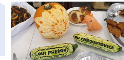
Ozdobné vyřezávání mají Chroustovičtí v malíčku, jak ukázali při návštěvě partnerské školy ve slovenském Prešově.