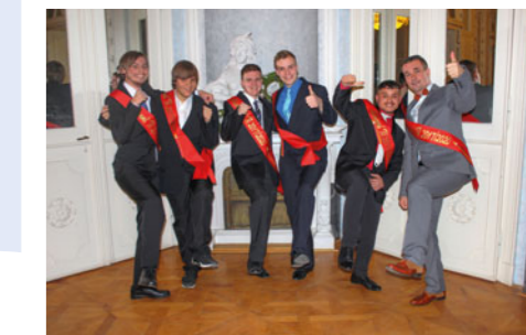
Slavnostní róby, účesy, obleky, lakýrky – a jde se na věč! Stučkovací ples třetích ročníků je mezi žáky nesmírně populární.