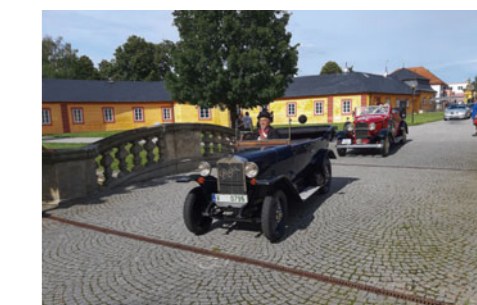
Díky spolupráci s regionálním muzeem ve Vysokém Mýtě se po zámeckých nádvořích občas prohánějí nabýškané veterány, které uchvátí srdce každého milovníka aut.