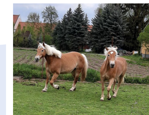
Mezi nejoblíbenější obyvatele chroustovického zámku patří bezpochyby klisna Ariela.