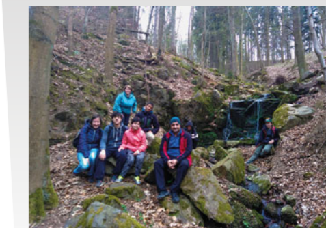
Žáci organizovaní v rámci SK Integra vyrážejí často odpoledne za turistikou – zábava je to pokaždé, někdy pak i pořádný test fyziky.

„Měl jsem štěstí na fajn školu a i na praxi jsou moc příjemní lidé.“