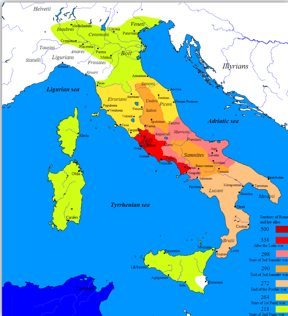
Římská republika před Samnitskými válkami a po nich

BEDNAŘÍKOVÁ, Jarmila a kol. Ovládnutí Apeninského poloostrova Římem. In: Dějepis. Pravěk a starověk . Praha: Nová škola, 2011, s. 94-95.