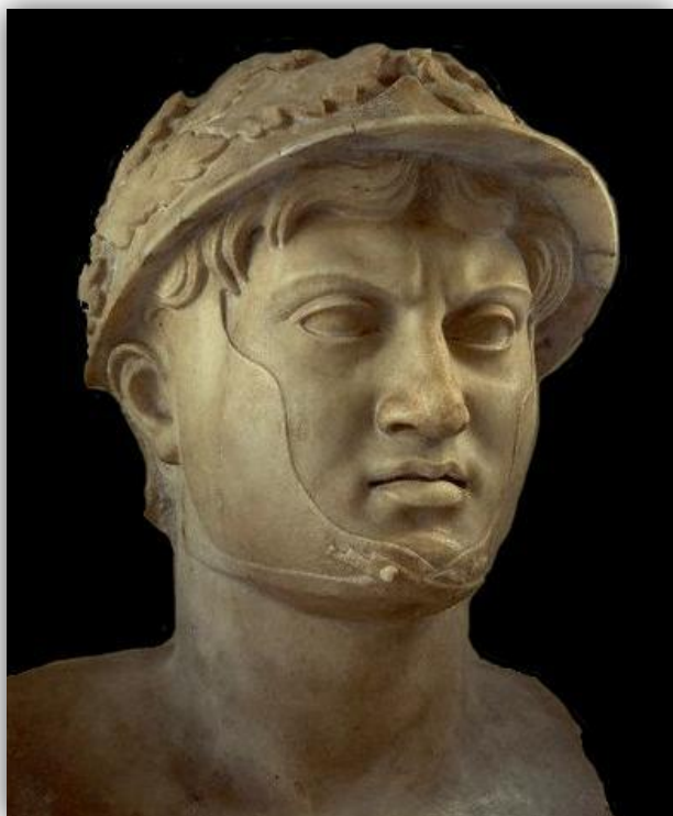
Pyrrhos I. Épeirský (Museo Archeologico Nazionale, Neapol)