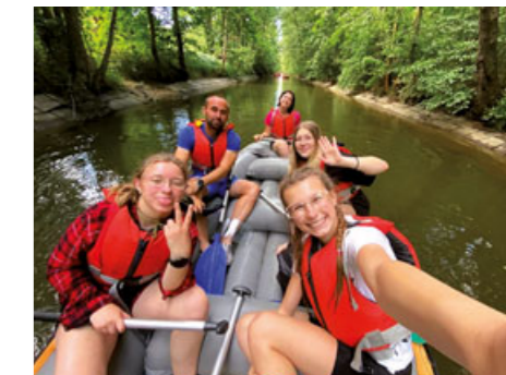
Při sportovních a turistických kurzech čekají na žáky nejrůznější sportovní disciplíny včetně atraktivní plavby na raftech.