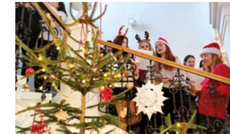
Cestu na vánoční prázdniny zpestřuje tradičně studentům i pedagogům oblíbené zpívání na schodech.