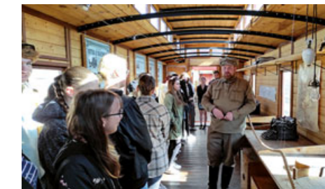
Studenti „zdrávky“ se zajímají i o významné společenské a politické události – navštívili třeba Legiovník, pojízdné muzeum československých legií bojujících za I. světové války.