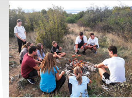
Žáci třetího a čtvrtého ročníku se už podruhé zúčastnili odborné a poznávací exkurze do rumunského Banátu.

„Kdyby ta možnost existovala, určitě bych ji hodně zvažovala. Myslím, že pro mne by bylo ideální rozdělení práce půl na půl ve zdravotnictví a v pedagogické činnosti. Přece jen bych se ještě nechtěla úplně vzdát působení ve zdravotnictví, protože práce sestry mě stále naplňuje a baví. Navíc se domnívám, že je velice důležité vnést do učitelství i zkušenosti právě z praxe,“ naznačuje, že návrat do míst, kde začala její zdravotnická kariéra, není zcela vyloučen.