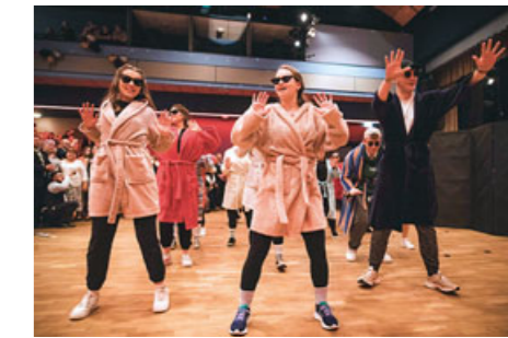
Maturitní ples se koná pravidelně v únoru ve svitavském kulturním domě Fabrika.