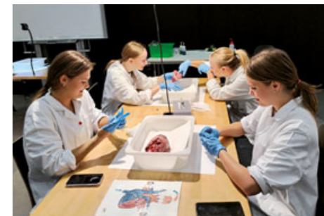
Studenti pardubické „zdravky“ jsou připraveni na všechno – tak jako na tomto snímku na pitváni prasečího srdece.