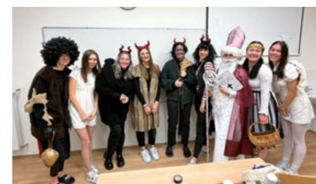
Veselo bývá ve škole i na Mikuláše, kdy se rolí pohádkových bytostí ujímá všestranné studentky.