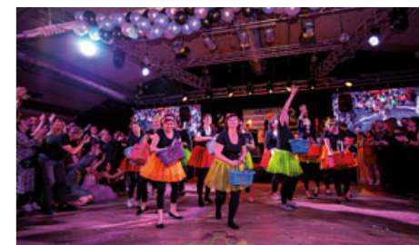
Maturitní plesy v pardubickém paláci Atrium patří tradičně ke společenským vrcholům školního roku.