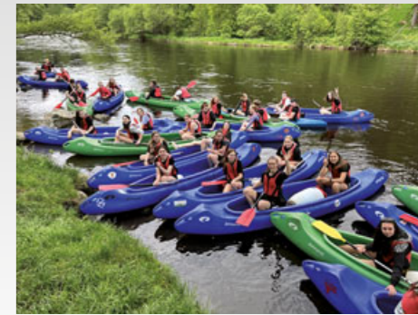
Při posledním vodáckém kurzu třetích ročníků absolvovali jeho účastníci padesát kilometrů dlouhou plavbu na kánoích po Vltavě.