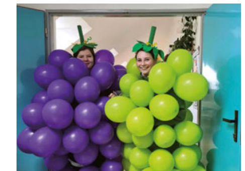
Poslední zvonení je pro maturanty tradiční příležitostí, jak se vtipně a s humorem rozloučit se školou.