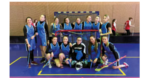
Mezi nejoblíbenější sporty ve škole patří zejména florbal – ostatní družstvo dívek skončilo v okrese Chrudim na druhém místě.