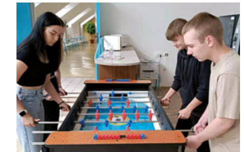
Ve volném čase si lze zahrát přímo ve škole také stolní fotbal.