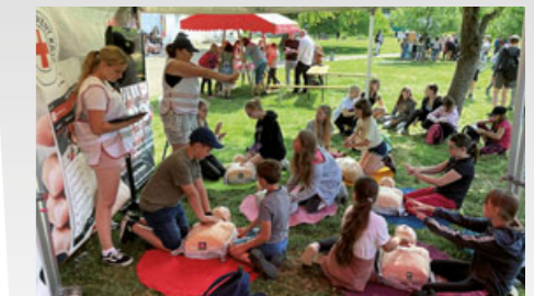
Při Dnu dobrovolnictví v Klášterních zahradách ukazovaly zásady první pomoci také studentky chrudimské zdravotky.