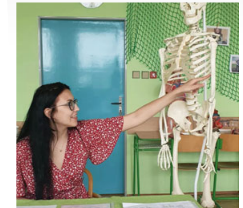
Takhle to vypadá při maturitní zkoušce.