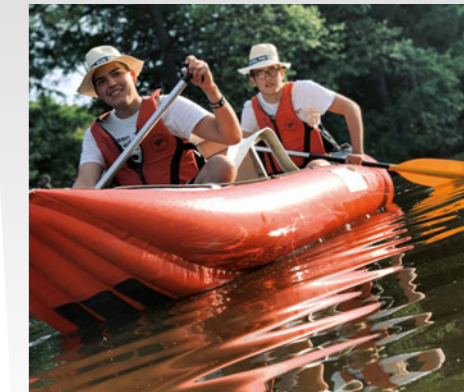
Vodácký kurz na Sázavě absolvovali žáci z Chvalčovic také ve společnosti kladrubských kolegyn.

„Momentálně stavím závodní motocykl značky Mustang, který jsem koupil od spolužáka. Je skvělé, že při tom můžu využít spolupráci s naším učitelem odborného výcviku i školní 3D tiskárnu. Už jsem s mustangem absolvoval jeden závod, ale ještě to nebylo úplně ono – rád bych stroj posunul ještě na vyšší úroveň,“ přibližuje svého velkého koníčka.