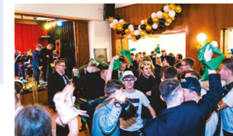
V únoru 2023 se v Domě kultury Chvalčovice uskutečnil první společný absolventský ples pořádaný společně se Střední školou chovu koní a jezdecký Kladruhy nad Labem.