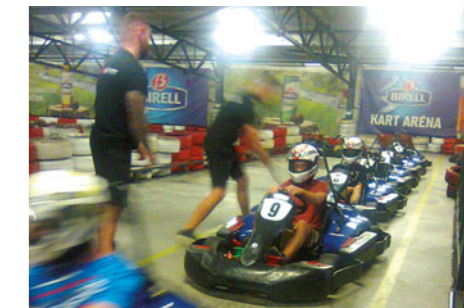
Druháci si zpestřili konec minulého školního roku návštěvou Kutné Hory a motokárového okruhu.