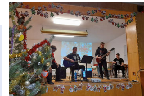
Program vánočních besídek si žáci obstarávají sami a jejich součástí samozřejmě bývají hudební vystoupení.