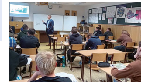
Prostřednictvím pravidelných přednášek a workshopů se seznamují žáci z Chvalčovic se zásadami finanční gramotnosti.