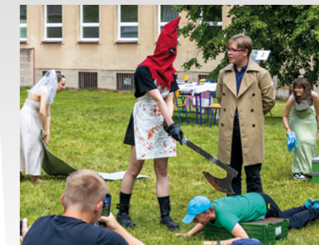
Do oslav 70 let školy se zapojili také její současní studenti, a to převážně v nevážném duchu.

„Fotografování znamená volnost, kreativitu i možnost osobního vyjádření.“