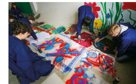
Škola zorganizovala projektový den pro žáky ZŠ z Pardubic-Svitkova, v němž se seznámili s graffiti a street artem.