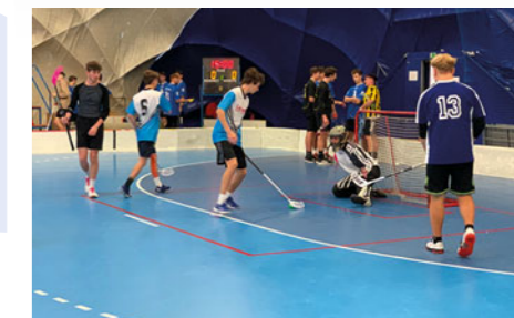
Ve zdravém těle zdravý duch platí i pro „grafiky“ z Přelouče – k oblíbeným sportům zde patří především florbal.