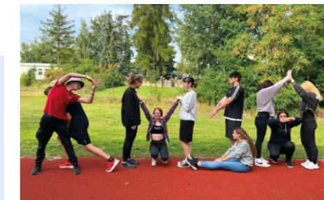
Všechny nováčky čekají v Přelouči krátce po nástupu adaptační kurzy na stmelení kolektivu v nedaleké obci Břehy.