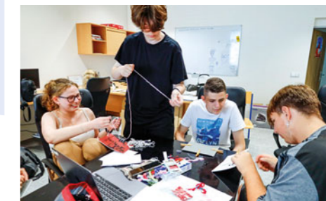
Svázní knih básní vztahujících se k městu Přelouč japonskou vazbou, které za pomoci umělé inteligence vytvořili budoucí reprodukční grafici pro média, vyžadovalo pečlivost.