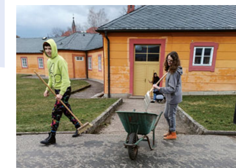
V rámci Dne Země se pustí pilně do práce všichni žáci a po dlouhém zimním období vyčistí celý zámecký areál.