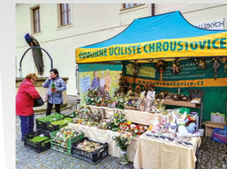
Chroustoviccké učiliště se tradičně prezentuje na veřejnosti při oslavách Velikonoc na zámku v Pardubicích, kde jeho stánek patří k nejnávštěvovanějším.