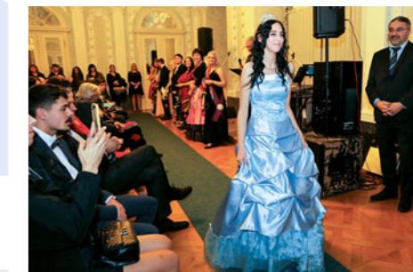
Po tříleté covidové přestávce se letos opět konal školní reprezentační ples, který bývá spojený se stužkováním absolventů.