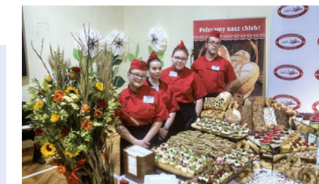
Kuchaři a cukráři z Chroustovic si vychutnávají svůj velký úspěch na mezinárodní soutěži gastronomických škol v Krakově.