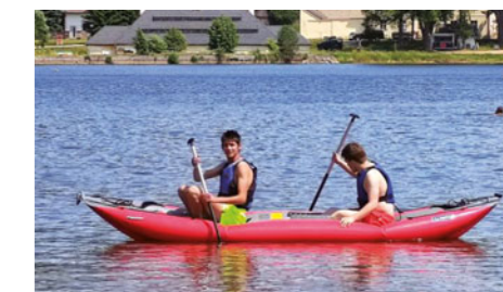
V závěru školního roku se žáci, kteří jsou členy SK Integra Chroustovice, účastní tradičního soustředění na Svatouchu, kde mají na programu i vodní aktivity.